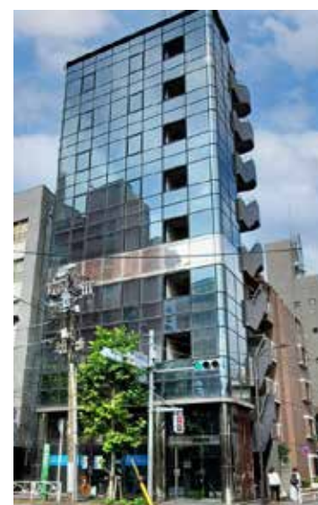
理知の杜日本語学校 東京校