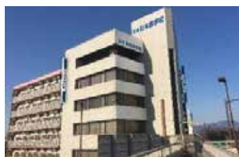
理知の杜豊橋日本語学校