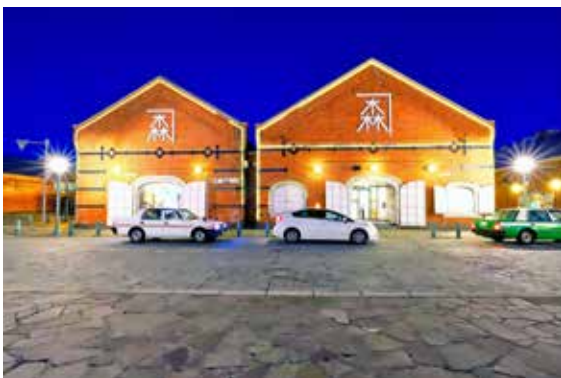
金森赤レンガ倉庫