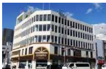
理知の杜岡崎日本語学校