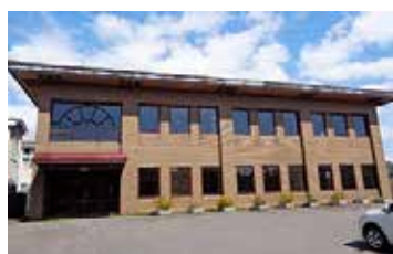
理知の杜日本語学校 函館校

函館校は、学校法人理知の杜グループの日本語学校として、岡崎、豊橋、仙台、東京に続き、5校目となります。