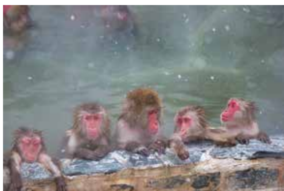
函館市熱帯植物園