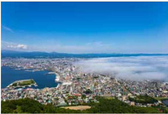
函館山からの街並み