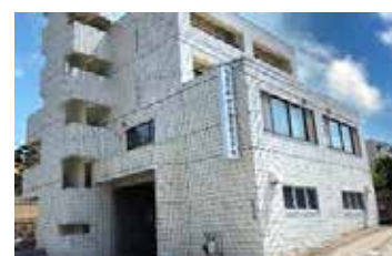
理知の杜日本語学校 仙台校